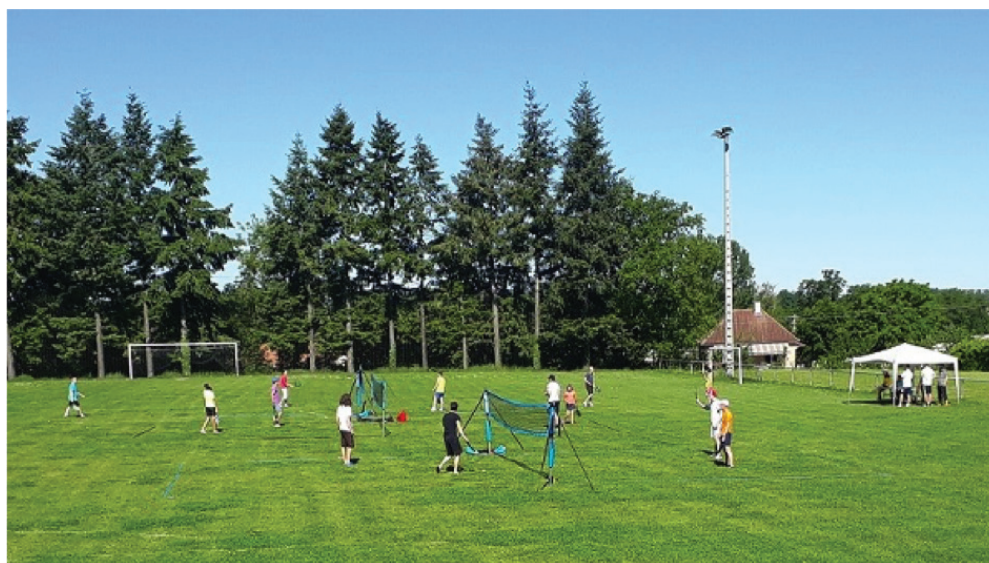
Le championnat de beach tennis à Lanuéjols