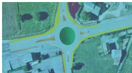
Rond point de bel air

-L'aménagement du rond point de Bel air , chantier espéré et nécessaire ! est terminé. La commune a pris en charge le financement de l'éclairage pour moitié (la commune de Vaureille a financé l'autre partie).