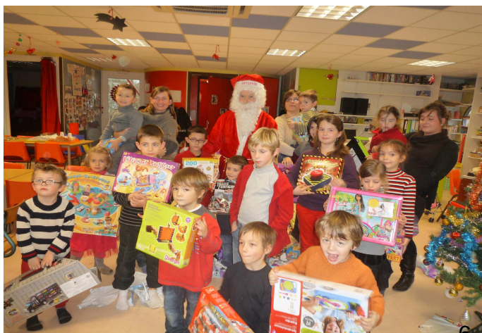
Le Père Noël en visite au foyer