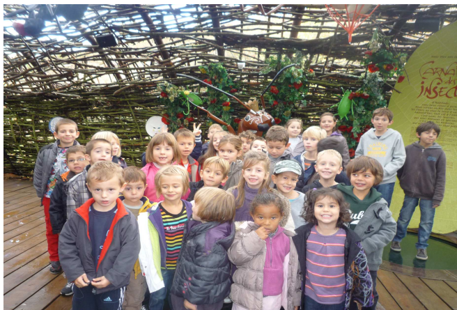
Sortie à Micropolis

Que les enfants se rassurent... ce n'est qu'un bref aperçu de ce que propose le Foyer!